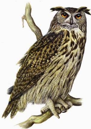
GUFO REALE ( Bubo bubo )

Gli esemplari di Gufo reale ( Bubo bubo ) sono ospiti del Centro Recupero Animali Selvatici del "Bosco Wwf di Vanzago" perchè frutto di sequestro penale. Infatti, questi magnifici esemplari sono stati detenuti da un privato illegalmente e in condizioni inadeguate.